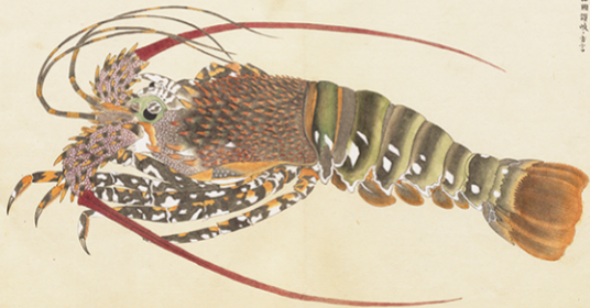
ニシキエビ (奈良坂源一郎「蟲魚圖譜 分冊四」から)