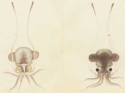
ミミイカ (奈良坂源一郎「蟲魚圖譜 分冊四」から)