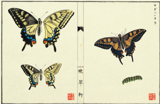
キアゲハ（奈良坂源一郎「蟲魚圖譜 分冊二」から）