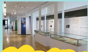
8 ES総合館・2008ノーベル賞展示室

学術的分子研究拠点「トランスフォーマティブ生命分子研究所 (ITbM)」。1階エントランスのギャラリー部分のみ公開。 開館時間: 9:30-17:15 休館日: 日・土曜・祝