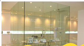
10 野依記念物質科学研究館 ケミストリーギャラリー

ケミストリーギャラリーでは、2001年ノーベル化学賞を受賞の野依良治特別教授の研究について展示。 開館時間: 10:00-16:00 休館日: 日・土曜・祝