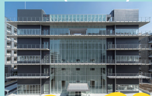
9 ITbM・ITbM Gallery

ケミストリーギャラリーでは、2001年ノーベル化学賞を受賞の野依良治特別教授の研究について展示。 開館時間: 10:00-16:00 休館日: 日・土曜・祝