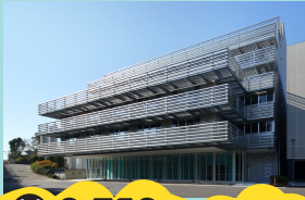
11 C-TECs AMANO Gallery

2014年ノーベル物理学賞を受賞した天野浩教授の功績を顕彰することを目的に、エネルギー変換エレクトロニクス研究館 (C-TECs) 1階に設置。 開館時間: 8:30-17:15 休館日: 日・土曜・祝 ※AMANOギャラリーへは、個別散策でご利用ください