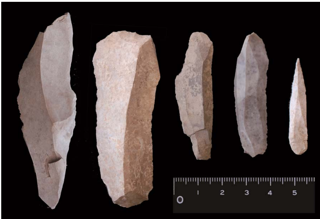
図 2 ：北レヴァント内陸部（ワディ・ハラール 16R 遺跡）において発見された石器資料

次に、この新資料を含めて、これまでに報告された前期アハマリアン関連の石器標本（15 遺跡）の形態や製作技術を定量的に分析し、プロト・オーリナシアン文化の石器技術と比較しました。また、両文化の放射性炭素年代 註4 （前期アハマリアン 68 点、プロト・オーリナシアン 58 点）を、試料前処理法や測定法を考慮しながら詳細に比較しました。その結果、プロト・オーリナシアン文化の石器標本に形態や製作技術が似ている石器群を前期アハマリアン文化の遺跡から抜粋して年代を比較すると、プロト・オーリナシアン文化の方が古い可能性を示しました（ 図 3 ）。つまり、4 万 2 千年前頃にレヴァントからヨーロッパへ石器技術が拡散した証拠は見直されるべきであることを、新たに提唱しました。