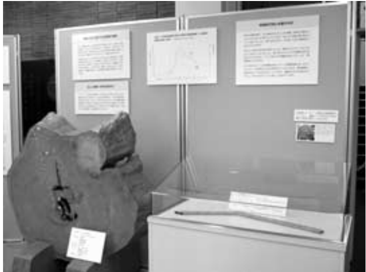
図3 木曽ひのきと年代学コーナー

名古屋大学では、AMS法を使って木曽ひのきの各年輪の ^{14}\text{C} 濃度を精密に測定しました。その結果、1962年は1950年の1.4倍、1964年は1.88倍の ^{14}\text{C} を含むことが分かりました。核実験は1955年ごろから増えだし、1962年には1年間に133回も行われています。年輪中の ^{14}\text{C} 濃度の変化は、この核実験の頻度と数年遅れで一致しています。