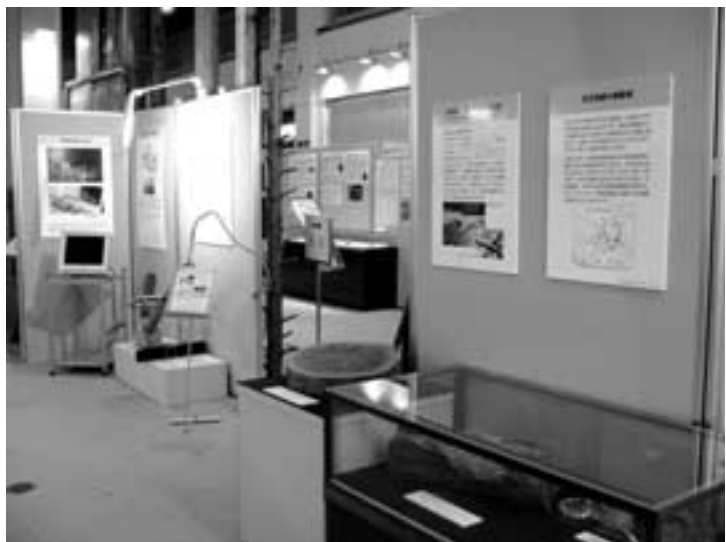
図9 上矢作町の幻の湖コーナー

岐阜県の長野県境に近い矢作川上流沿いに「海」という地名があります。しかし、その由来はよくわかっていませんでした。平成12年9月11～12日の東海豪雨で、この地域が湖だったと考えられる「埋もれ木」を含む、細流砂～シルトの地層が見つかりました。「埋もれ木」は、大きいものでは長さが十数メートル、根元の直径が70センチに達する大きなものです。