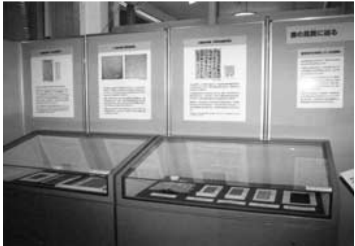
図10 書の真贋に迫るコーナー

炭素14年代測定法は、縄文時代・弥生時代など古い時代のための測定法というイメージが強いのですが、古文書のような比較的新しい時代の資料にも利用することができます。