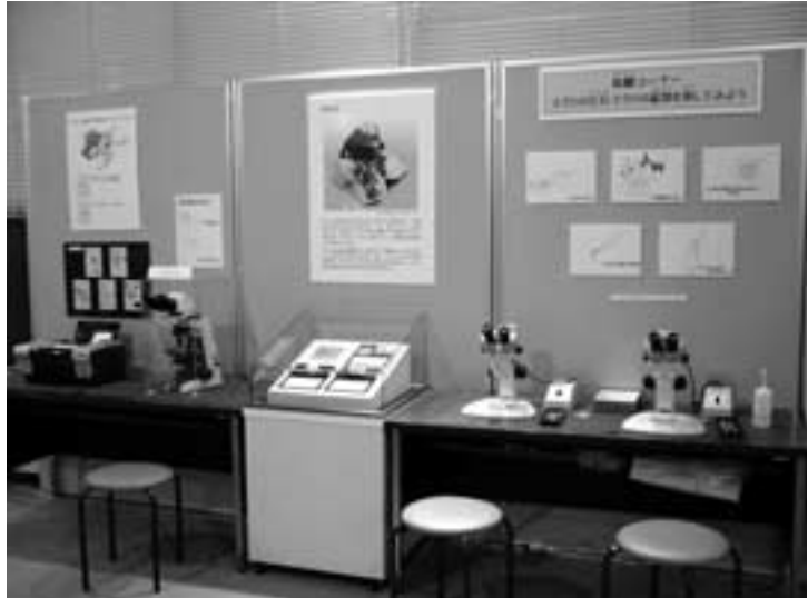
図12 体験コーナー 2

ジルコンの結晶は しかくすいじょう 四角錐状ないし短柱状で、透明やピンク、茶色などいろいろな色のものが多く見られます。また、ペグマタイト中には大型の結晶を産し、まれに数cmの大きさに達するものもあります。ノルウェー北部の花崗岩から産する標本（写真）は特に有名です。