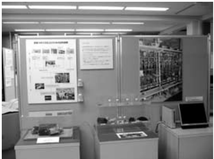
図11 炭素14年代測定法のための試料調整コーナー