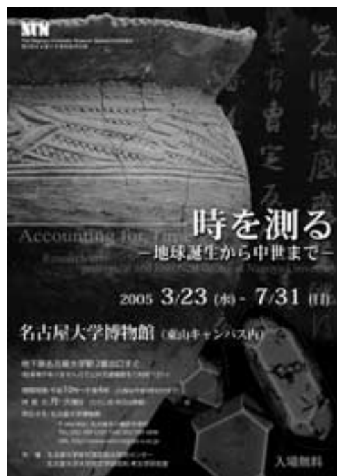
図1 特別展ポスター

年代測定にはいろいろな方法があり、樹木の年輪を数えるのも年代測定の一つで、年輪年代(dendrochronology)の第一歩です。よく使われるのは化石を用いる方法で、恐竜の化石はマンモスの化石より下(すなわち、より古い時代)の地層から見つかり、三葉虫の化石は恐竜の化石より下の地層から見つかるので、三葉虫が一番古く、次に恐竜、最も若いのがマンモスという具合です。しかし、一般に、化石から分かるのは、化石を含む地層の新旧関係から推定される地質時代(相対年代)だけです。