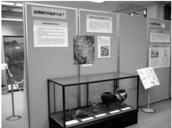
図7 古墳時代の始まりは？ コーナー

弥生時代から引き続いて、古墳時代も米を炊いたり、魚介類などを煮たりする土器（甕）が作られました。とくに、下に台が付いている甕を台付甕と呼んでおり、弥生時代後期から古墳時代前半にかけてのみ見られる東海地域特有の土器です。甕の表面にはススが付いていますが、これは木など、生物の炭素がついているので、これらのススから土器が使われた年代を測定することができます。