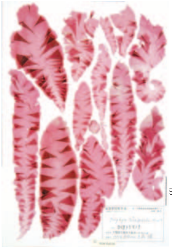
カイガラアマノリ NUM-Bs0120