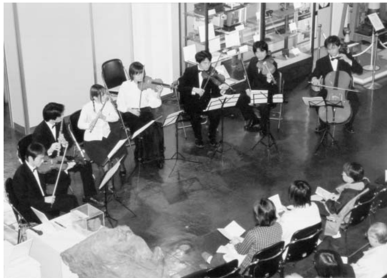
図13 博物館コンサート