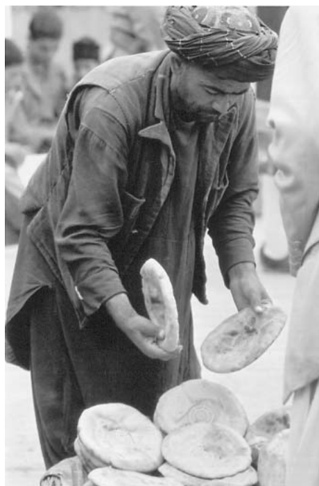
図5 アフガニスタンの主食 ナン