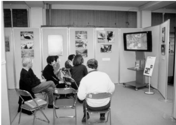
図9 記録映画コーナー