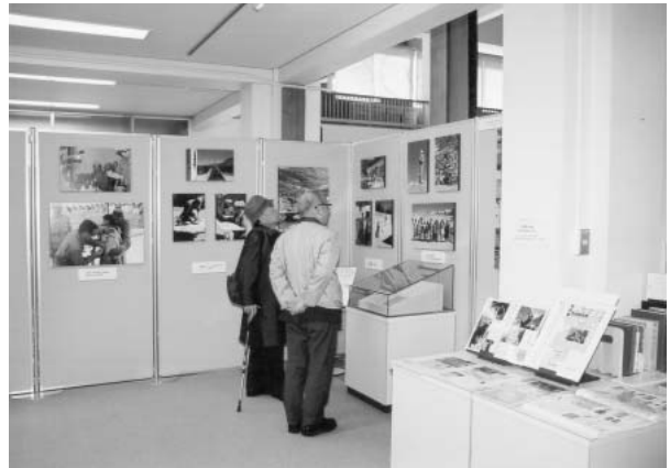
図10 写真パネルのコーナー（部分）