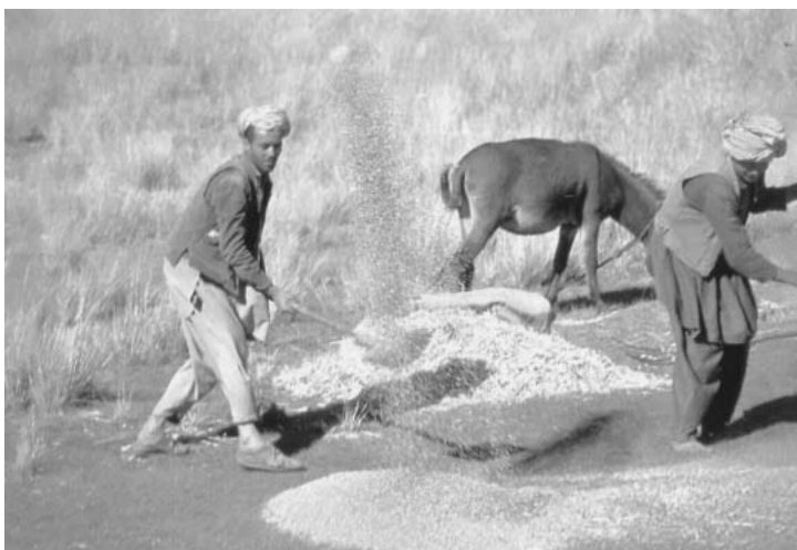
図6 小麦の風選風景