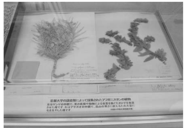
図12 生物コーナー（アフガニスタンの植物）