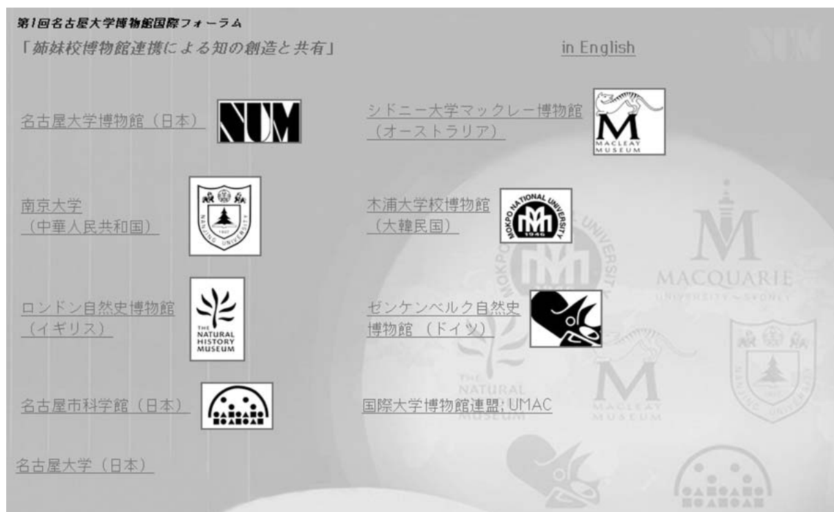
図4 IDT-LF2のインターネット初期画面に設定した、フォーラム参加機関の紹介ホームページ。ページ内の各機関名およびロゴには、それぞれのURLがリンク指定してある。

IDT-LF2で、インターネット初回接続時にHPを表示させるため、IDT-LF2の「インターネット設定」画面の「ホームの設定」において、HPのURLを指定した。