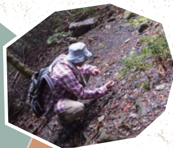
松脂岩の露頭を見学

2016年に、愛知の自然のシンボルとして「愛知県の石」が日本地質学会によって選定されました。その石の1つが「松脂岩(しょうしがん 英語でピッチストーン)」です。この岩石について学習し、その主要産地の鳳来寺山に出かけます。