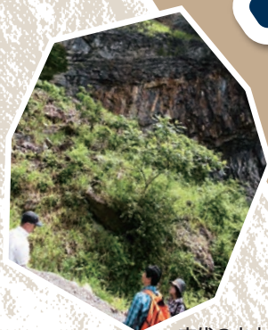
古代の火山との関係について解説