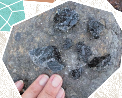
天然ガラスによる石器づくり体験